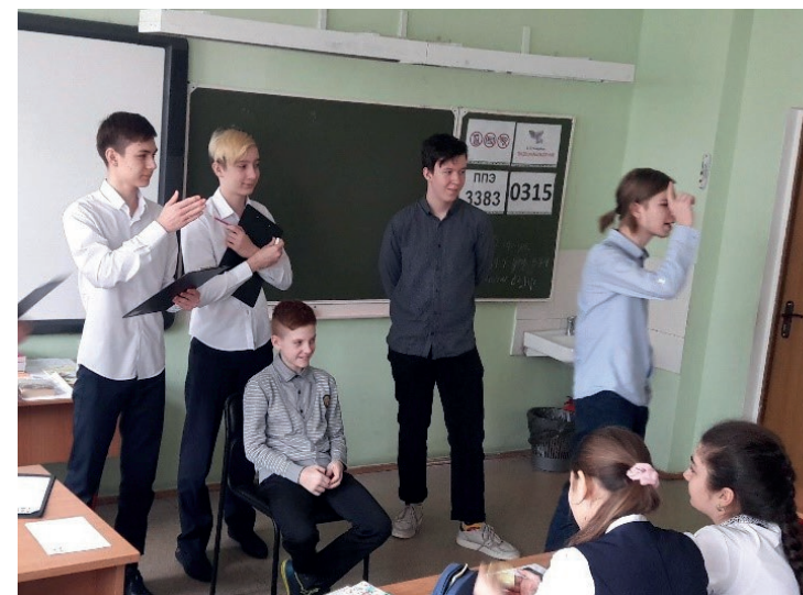
Проект «Командообразование», волонтеры 9-го класса работают с 5-м классом.

Потенциальные волонтеры готовят свое краткое резюме (заполняют готовую анкету), ищут волонтерские вакансии, предлагают свои услуги.