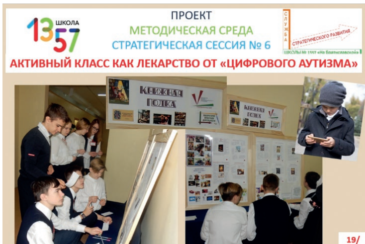
В рамках компании «Школьные локации» создан интерактивный волонтерский проект «Книжная полка», представленный на педагогическом совете школы.

Каждая волонтерская позиция должна быть четко описана: возрастные и, если есть, гендерные требования, необходимые компетенции, график занятости, ответственность и нагрузка и пр., что относится к необходимости для волонтера понять, насколько эта вакансия соответствует его интересам и возможностям.